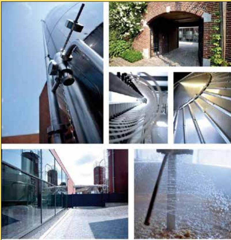
Visite de la Brasserie St-Feuillien

Pour les groupes : tous les jours de 10h à 18h sur réservation. / Pour les individuels : tous les samedis à 14h sans réservation. / Infos : visite.stfeuillien@gmail.com ou 0498/86.41.82 / www.st-feuillien.com